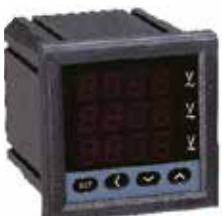
PA/PZ7777-S Трехфазный цифровой амперметр, вольтметр