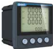
PD666-S3 Трехфазный многофункциональный измеритель с ЖК-дисплеем