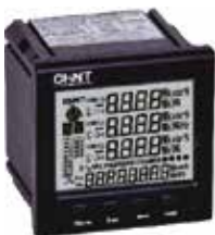
PD7777-S3 Трехфазный цифровой многофункциональный измеритель с ЖК-дисплеем