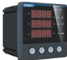
PD666-S4 Трехфазный цифровой многофункциональный измеритель